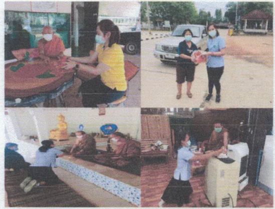
จัดทำหน้าากอนามัยให้พระภิกษุ สามเณร