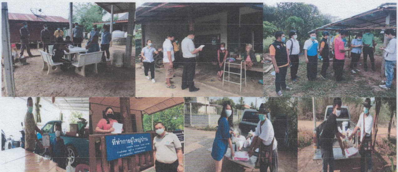
ออกติดตามผู้ที่ถูกกักตัว 14 วัน ร่วมกับ อำเภอ ตำรวจ สาธารณสุขอำเภอ รพ.สต. โรงพยาบาล ผู้ใหญ่บ้าน และ อสม.ออก หนังสือคำสั่งกักตัว 14 วัน และนำไปให้ผู้ถูกกักตัวที่บ้าน พร้อมคำแนะนำการดูแลตนเองในช่วงกักตัว วัดใช้ทุกวัน โดยได้รับความร่วมมือจาก อสม.ประจำหมู่บ้าน ผู้ใหญ่บ้านได้นำถุงยังชีพมาแจกจ่ายให้ผู้ที่ถูกกักตัว โดยการสนับสนุนจาก อบต.