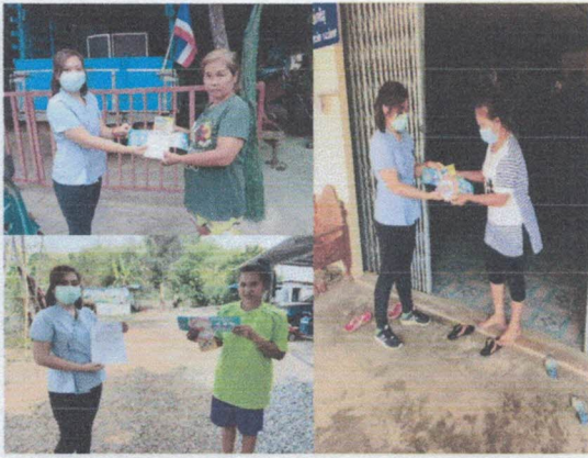
แจกสื่อประชาสัมพันธ์ความรู้เสี่ยงตามสายในหมู่บ้าน