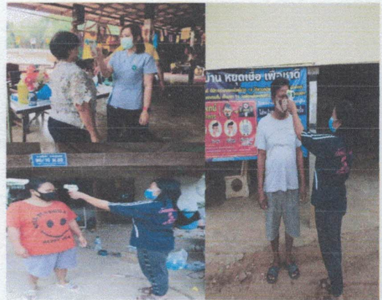
วัดใช้ในงานต่างๆ ผู้ที่เดินทางกลับมาจากต่างจังหวัด และผู้มีโอกาสเสี่ยง โดย จน.รพ. และ อสม.ประจำ