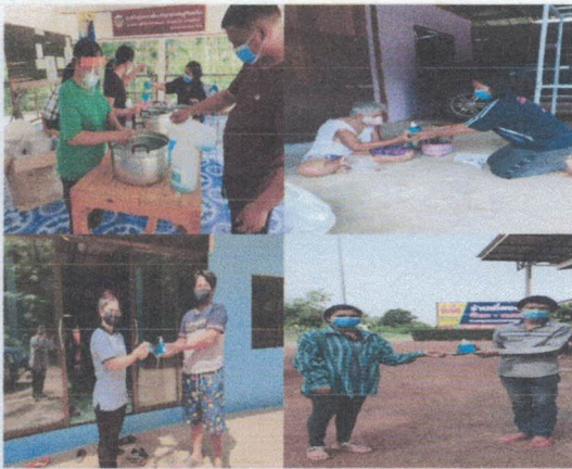
ผู้นำชุมชน อสม.และชาวบ้านในหมู่บ้าน ร่วมกันจัดทำ เจลแอลกอฮอล์ล้างมือแจกภายในหมู่บ้าน