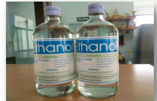
แอลกอฮอล์ 95