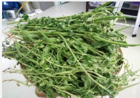
ผักเสี้ยนผี