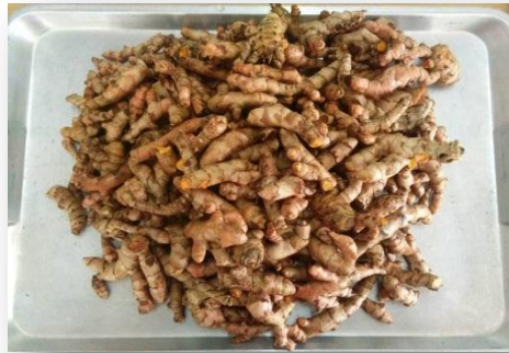
ขมิ้นชัน