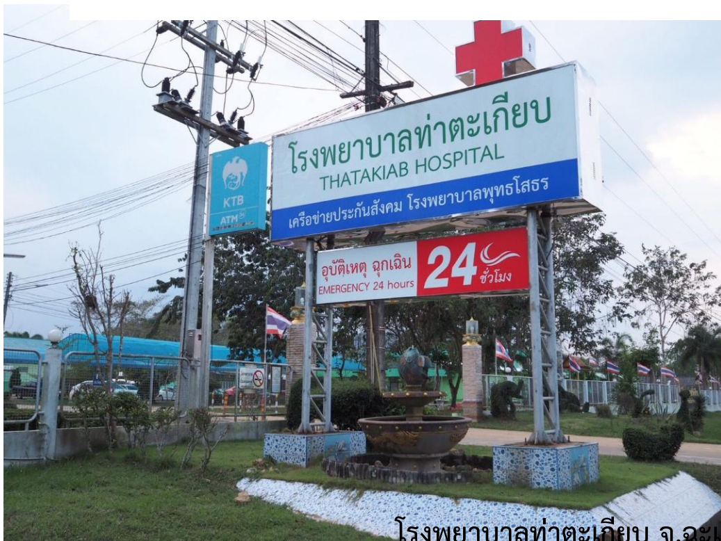
โรงพยาบาลท่าตะเกียบ จ.ฉะเชิงเทรา